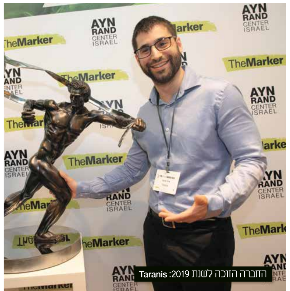
החברה הזוכה לשנת 2019: Taranis