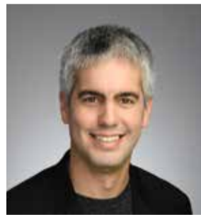
דור אבוזצירה