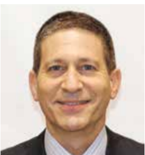
רון זכר

חברת פרמיה ספיין (Premia Spine) פיתחה מפרק מלאכותי ייחודי עבור הגב התחתון לטיפול בחולים עם בעיות גב קשות הדרושות ניתוח