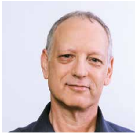
בוז ארד

פרויקט פרס האטלס חוגג זאת השנה החמישית את ערכי היצרנות, היוזמות והחדשנות בישראל - ערכים שעומדים ביסוד פעילותן של חברות הונק שיוצרות מוצרים, טכנולוגיות ושירותים חדשניים, המקדמים את חיינו בעולם. הפרס נועד להוקיר את האנשים שלוקחים חלק בפעילות ברוכה ויוצאת דופן זו, אנשים שפורצים, כיום ולכל אורך ההיסטוריה, "דרכים חדשות כשכל ציודם הוא החזון שלהם", כפי שכתבה הסופרת והפילוסופית היהודייה-אמריקאית, איין ראנה.