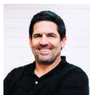
בן אלפי

חברת רובוטיקה כחול לבן (Blue White Robotics) מפתחת פתרון רובוטי אוטונומי למשימות הזקלאות השונות, המתבסס על התאמת כלי העבודה הקיימים ברשות הזקלאי והפיכתם לאוטונומיים