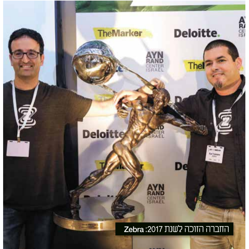
החברה הזוכה לשנת 2017: Zebra