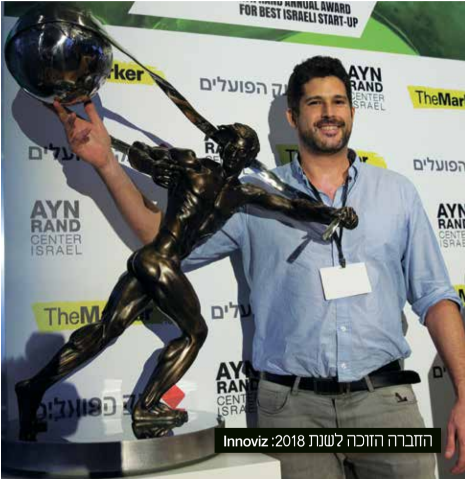
החברה הזוכה לשנת 2018: Innoviz

פרס על מפעל חיים גיון אליסון מאמין שלהצלחה או לכישלון יש מעט מאוד קשר למזל עמ' 03